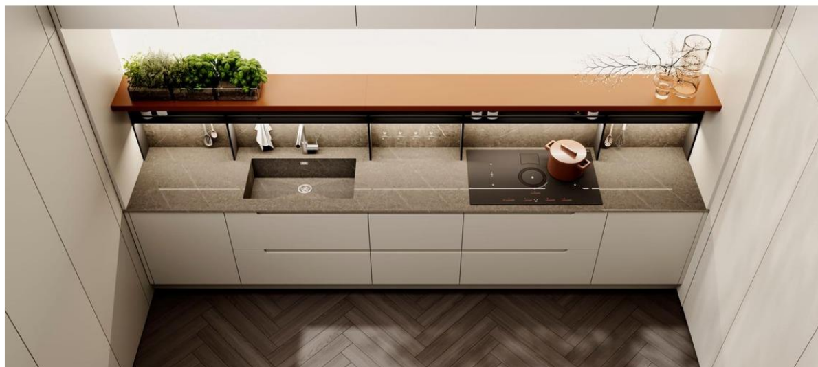
Cucina Modula di Febal Casa.